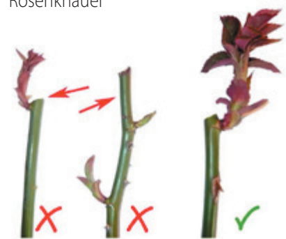
Richtige Schnittführung rechts

Und jetzt wird's spannend, denn nicht jede Rose tickt gleich.