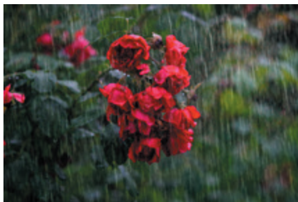
Regennasse Blüten bleiben, besonders wenn sie gefüllt sind, lange nass und führen zu Grauschimmel oder anderen Krankheiten