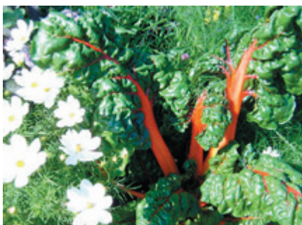
Farbiger Mangold ('Bright Lights') und weiße Schmuckkörbchen: essbares Gemüse und essbare Blüten!

Für Kinder und Erwachsene ist es ein einprägsames Erlebnis, den Pflanzen beim Wachsen zuzusehen und auf die Ernte zu warten. Es berührt uns, wenn aus Samen oder Jungpflanzen eine neue Pflanze und eine eigene Ernte heranwächst. Natürlich sind wir dann als stolze Produzenten absolut davon überzeugt, dass „unserer Arbeit Früchte“ besser schmecken als gekaufte Erdbeeren, Tomaten oder Basilikum. Vor der eigenen Nase, ohne lange Lieferwege und nur einen Schritt von der Küche entfernt zu ernten, ist ein Genuss, die Verwendung essbarer Blüten eine optische Bereicherung. In Balkonkisten oder kleinen Pflanzgefäßen kann dies gelingen. Wichtig sind dazu das Wissen über passende Arten und Sorten, die mit wenig Wurzelraum gedeihen können und die Kenntnis über die richtige Wasser- und Nährstoffversorgung.