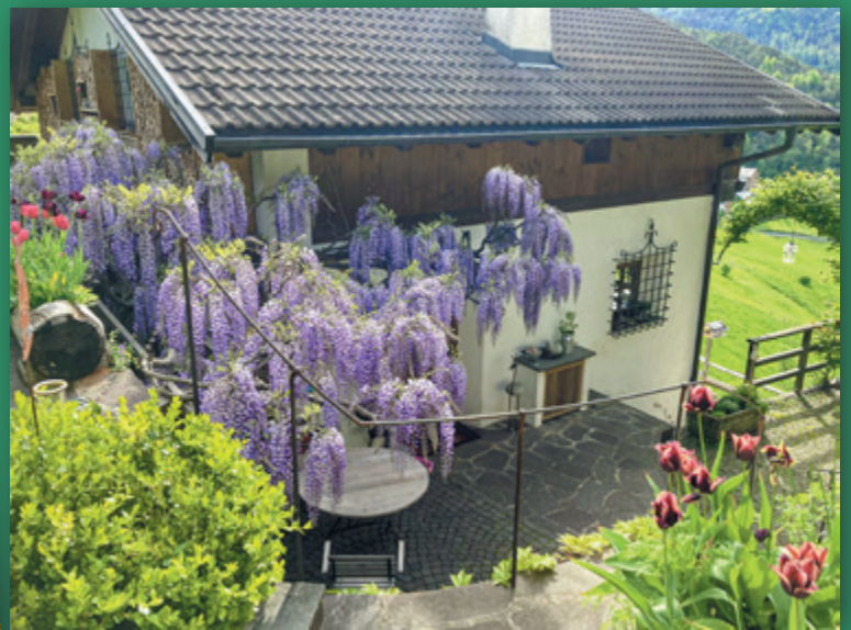
Trude Fichtel: „Blütenpracht vor der Haustür“