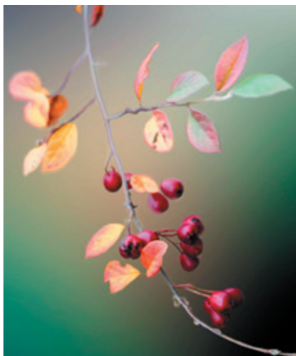
Wildrosen brauchen keinen Sommerschnitt, sie bilden nach der Blüte dekorative Hagebutten

Rosen für intelligente, faule Gärtner: Wildrosen, Ramblerrosen und einmalblühende Rosen bilden nach der ersten Blüte Hagebutten und es ist deshalb nicht sinnvoll, die Blüten zu entfernen.