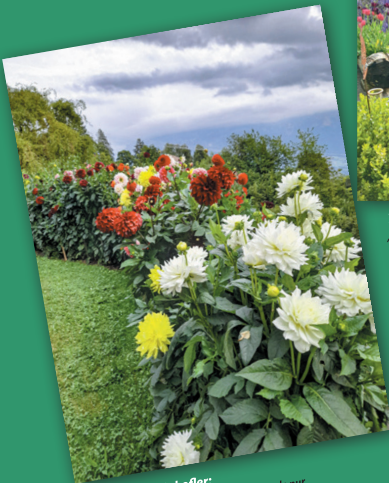
Maria Schweigkofler: Das war unser Dahliengarten 2026. Freude pur