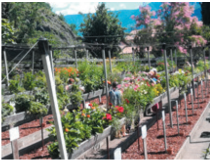
Versuchsbalkone am Versuchszentrum Laimburg im Mai 2021

Essbare Pflanzen auf Balkon und Terrasse liegen im Trend. Der Wunsch nach Selbstversorgung, frischen Kräutern, Gemüse oder Beeren – auch ohne eigenen Garten – wächst stetig. Um zu zeigen, welche Pflanzen sich dafür eignen und wie sie sich unter beengten Bedingungen entwickeln, wurde 2021 der Balkonversuch „Naschbalkon“ am Versuchszentrum Laimburg durchgeführt. Die Ergebnisse wurden dem Fachpublikum (Südtiroler Gärtner:innen) und den interessierten Besuchern am Tag der offenen Tür vorgestellt.