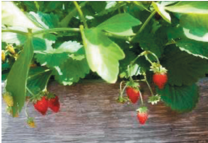
Walderdbeeren (hier die Sorte 'Alpin') hängen über den Balkonrand und verführen zum Naschen

Selbstversorgung und die Möglichkeit auch auf kleinem oder kleinstem Raum essbare Pflanzen zu produzieren, liegt im Trend. Wer nicht über einen eigenen Garten verfügt oder diese Genusspflanzen näher an den Wohnraum bringen möchte, kann Gemüse, Kräuter, essbare Blüten oder Obst auf Balkon und Terrasse anpflanzen und genießen.