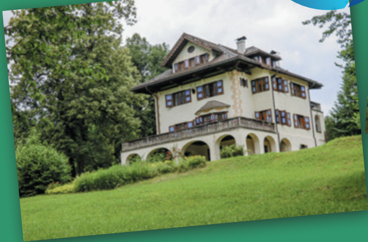
Elisabeth Oberrauch: Zwischen unserem Sommerhaus und dem Wald haben wir eine Blumenwiese mit hoher Artenvielfalt, welche nicht gedüngt und nur 2 x im Jahr gemäht wird.