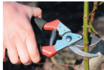
Gut geschliffene und desinfizierte Bypass-Schere für den Rosenschnitt verwenden

Stumpfe Scheren sind wie schlechte Friseure: Man merkt es erst, wenn es zu spät ist.