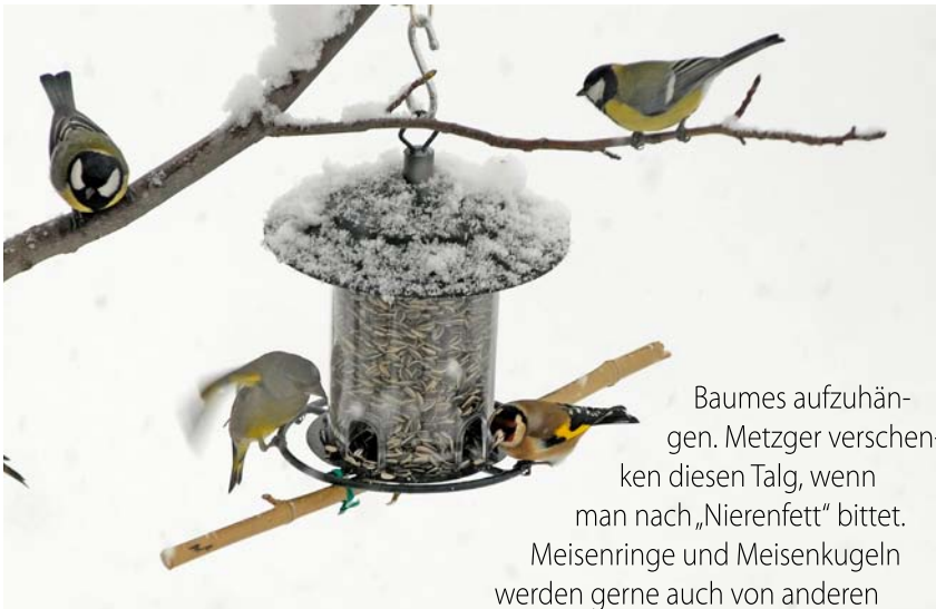
Baumes aufzuhängen. Metzger verschenken diesen Talg, wenn man nach „Nierenfett“ bittet.

Meisenringe und Meisenkugeln werden gerne auch von anderen Singvögeln genutzt. Ein hängendes Futtersilo mit verschiedenen Körnern ist auch sehr willkommen. Die herunterfallenden Sämereien sättigen auch Finken und Amseln, denn diese picken lieber am Boden.